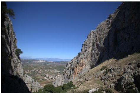
Χούνη Αγίου Βασιλείου

Ακολουθούν φωτογραφίες από τα εξαιρετικής ποιότητας, ιδανικά για αναρρίχηση, ασβεστολιθικά βράχια της Χούνης του Αγίου Βασιλείου και του Σολωμού.